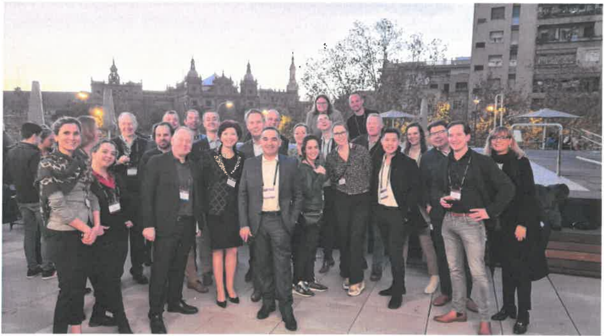
EANM Focus Meeting, Sevilla 2023, met de Nederlandse groep en enkele internationale experts.