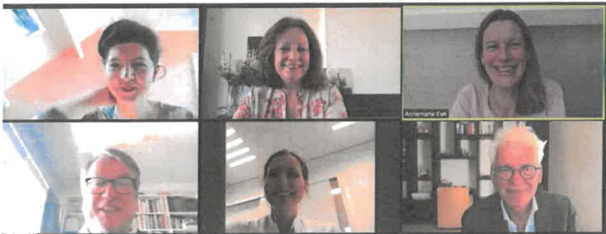
Een online bestuursvergadering van Stichting PSMA forum NL

Het bestuur is onafhankelijk en heeft een onafhankelijke voorzitter. Elke drie jaar treedt minimaal één bestuurslid af. Een volgens het rooster aftredend bestuurslid kan éénmalig opnieuw benoemd worden. Het bestuur is onbezoldigd, kosten gemaakt t.b.v. de stichting kunnen binnen een termijn van drie maanden worden gedeclareerd.